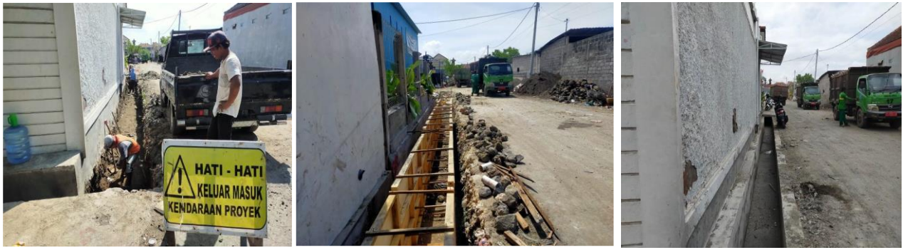
Kegiatan Paving Kelurahan